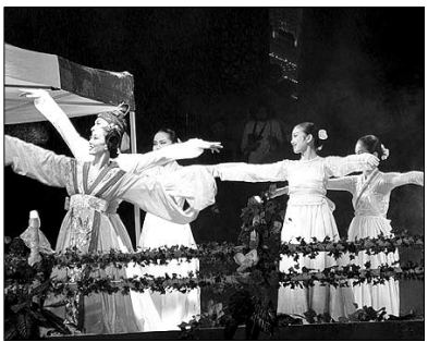
견우와 직녀가 만나는 모습을 춤으로 형상화한 공연.