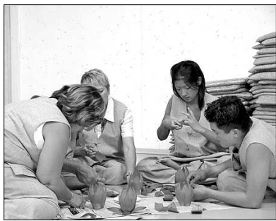
프랑스 한국인양아들이 부산 범어사에 모여 연꽃 만들기 등을 통한 모국문화체험을 하고 있다.