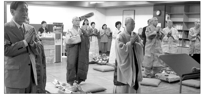
대구지역의 불교전문도서관 역할을 담당할 보현문화관의 개관식 모습.