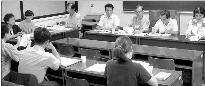
초보불자를 위한 책임기모임 '붓다와 떠나는 책 여행'. 10월 정식 운영에 앞서 8월 15일 모임을 가졌다.

선정된 책 한 권씩을 품어 안고 사람 문을 나서는 회원들의 눈에 새로운 책에 대한 호기심이 스쳐 지나간다. (02)2685-2396