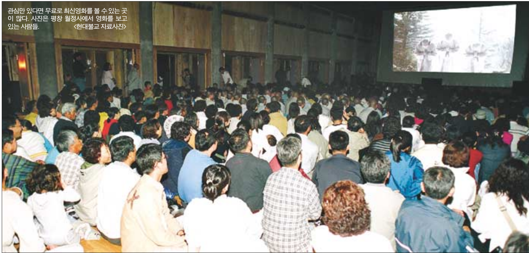
관심만 있다면 무료로 최신영화를 볼 수 있는 곳이 많다. 사진은 평창 월정사에서 영화를 보고 있는 사람들.