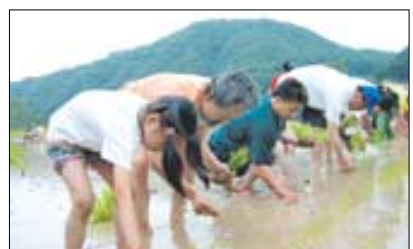
14기 불교귀농학교 참가자들과 수료생들이 모내기 실기 현장교육을 받고 있다.

‘불교와 귀농’. 그 구체적인 모습이 궁금하다면, 인드라마생명공동체가 마련한 불교귀농학교의 문을 두드려보자. 인드라마생명공동체는 9월 10일~11월 26일 매주 화·금요일 오후 7시 조계사 교육원에서 ‘제 15기 불교귀농학교’ 교육생을 모집한다. 교육은 ‘왜, 아직도 귀농인가’, ‘귀농과 여성의 삶’, ‘귀농해서 아이 키우기’, ‘농업이 무너져도 살 수 있을까’ 등 귀농에 관련된 이론과 체험으로 진행된다. 또 실상사지역공동체 및 강원도 행정 현장학습 등도 이뤄진다. 참가비는 10만원. (02)737-6181