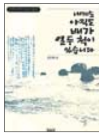
내게는 아직도 배가 열두척이 있습니다 김종대 지음 | 북포스 | 9천5백원

▲“아직도 신에게는 열두척의 전선이 있습니다. 죽을 힘을 다하여 막아 싸우면 아직도 할 수 있습니다. 전선이야 비록 적지만 신이 죽지 않았사오면, 적이 감히 우리를 업신여기지 못하리이다.”