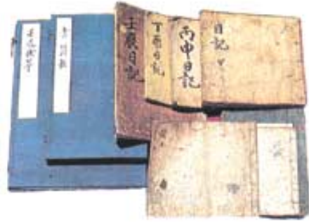
난중 일기와 편지.

이순신 장군은 우리나라에서 문학과 드라마, 영화는 물론 심지어는 도로 이름에 이르기까지 가장 많이 접하는 위인중의 한 분이다.