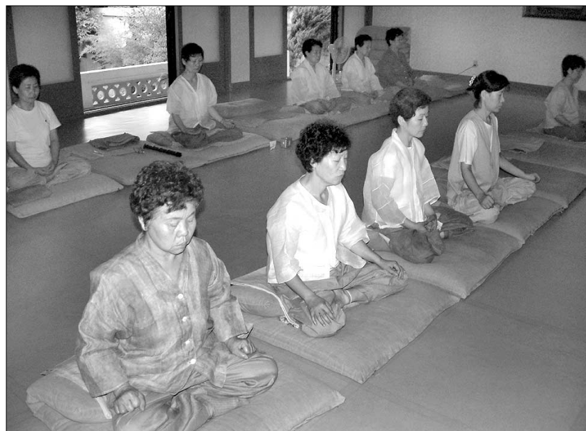
35년의 전통이 어린 전등선림에서 좌선중인 불자들이.

한다(仰信). 왜냐하면 <경>의 말씀은 가히 자신의 알은 식견으로 생각할 수 없기 때문이다.