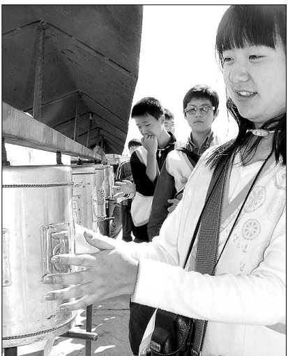
한국 청소년들이 몽골 간단사에서 한번 둘러보면 경문 만년을 와한다는 마니판을 들고 있다.