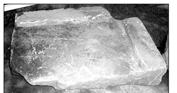
국보 제34호 창녕 숭정리 동3층석탑과 이 탑을 받쳤던 것으로 추정되는 바닥돌.

“석부재의 형태가 숭정리 동탑의 남아 있는 바닥돌과 같은 것으로 보아 바닥돌일 가능성이 높다”며 “탑의 원래 모습을 복원하는 데 도움이 될 것”이라고 말했다. 박익순 기자