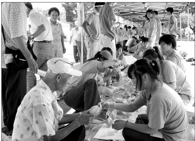
8월7일 부산 용두산공원에서 열린 '유니 붓다 페스티벌'에서 할아버지들이 학생들로부터 연꽃 만들기를 배우고 있다. 사진=천미희 기자

맞춰 입은 대학생들의 활기찬 움직임 끝에 막을 올린 불교문화체험현장은 나무 그늘에 앉아 무료하게 일과를 보내던 어르신들, 아이들의 손을 잡고 나들이에 나선 가족들의 눈길을 끌기에 충분했다. 그리고 불화 그리기, 단주 만들기, 반야심경 사경하기, 연등 만들기, 페이스페인팅 등 불교문화를 체험하기 위한 다양한 프로그램들이 진행되면서 불교문화와 시민들은 하나가 됐다.