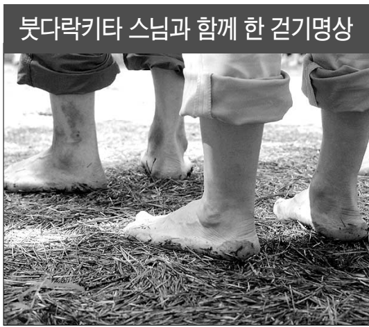
참가자들은 신발과 양말을 벗어던지고 발의 감각에 집중했다.

하늘을 찌를 듯이 솟은 잣나무 사이로 장대비가 내리 쏘인다. 번개가 '번쩍' 하며 하늘을 가르고 불어날 빗물 위를 내딛는 발걸음이 연신 미끄러진다. 과연 예정대로 프로그램을 진행할 수 있을까. 7월 25일 남양주 봉선사로 향하는 길에 근심이 가득하다.