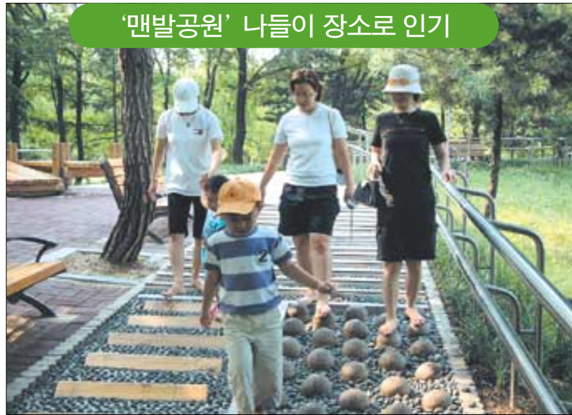
서울 동작구 보라매공원내 맨발공원을 찾은 가족들의 모습.

이밖에 양재시민의 숲과 월드컵공원에 있는 맨발공원들은 도시락을 싸가지고 가족 나