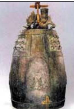
국보 제36호 상원사종과 탁본모습.