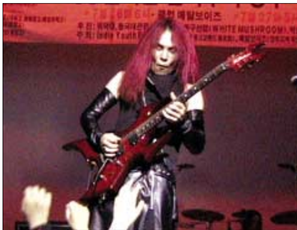
헤비메탈 '블랙홀' 공연모습.

양주 육지장사(주지 지원)가 영화제에 이어 포하나의 이벤트를 준비한다. 7월 31일부터 8월 1일까지 국내최고의 록(rock) 뮤지션들이 출연하는 '명상과 함께하는 록 뮤직페스티벌' 특별수련회가 그것.