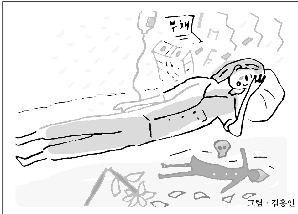
그림 · 김홍인

화들짝 깨어보니 아침시간이었다. '아, 꿈이었구나. 온종일 꿈속에서 본 비구니 스님이 선명하게 떠올랐다. 스님과의 대화는 무슨 의미일까? 무엇을 전달하고자 하는 것일까?' 시간이 오래갈 것이라는 것으로 결정을 내리고 한달한달 은행 결제일에 어학원이 부도나지 않게 하는 살얼음판을 걸으며 차츰차츰 지쳐가고 있었다. 영어권 외국인 강사 한 명과 더불어 학교강 강 수업과 원내수업만 하면서 가능한