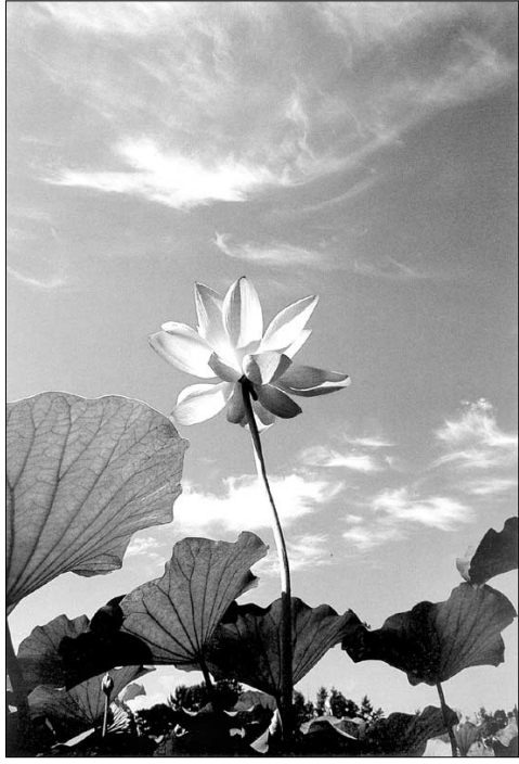
우리의 청정한 본성을 일깨워주는 연꽃. 선암 스님 작품.