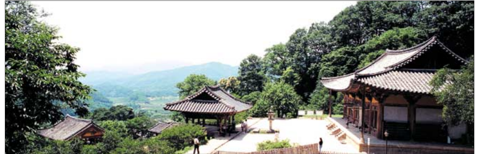
영주 봉황산 중턱에 자리잡은 부석사. 소백산맥과 무량수전의 조화가 절경을 이룬다.

것도 중요하거나 대학입시 또한 염두에 두지 않을 수 없기 때문이다. 방향을 맞아 불서를 통해 인성과 지성을 동시에 가꾸는 시간을 가져보자.