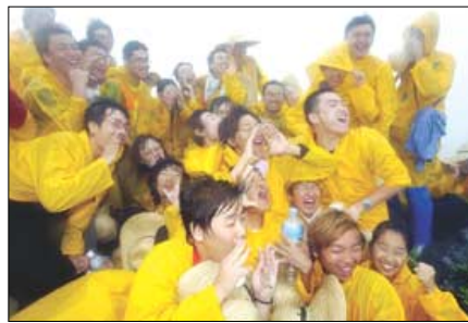
화염벌에서 대원들이 "천성산을 살리자"며 외치고 있다.

'고속철 2단계 공사 반대, 천성산 살리기, 국립의 소중함'이라는 주제로 진행된 '파란 2004'에는 청년환경센터, 사회당 학생위원회, 서울대, 고려대, 부산대 등 대학생 환경동아리 등에서 140여 대원이 참여해 총 150km를 걸었다. 강행군으로 허리뼈가 휘어질 정도의 심한 부상을 입은 대원 등 단 7명만이 귀가했을 뿐 흐트러짐 없는 발걸음으로 뚝뚝뚝 걸며 천성산