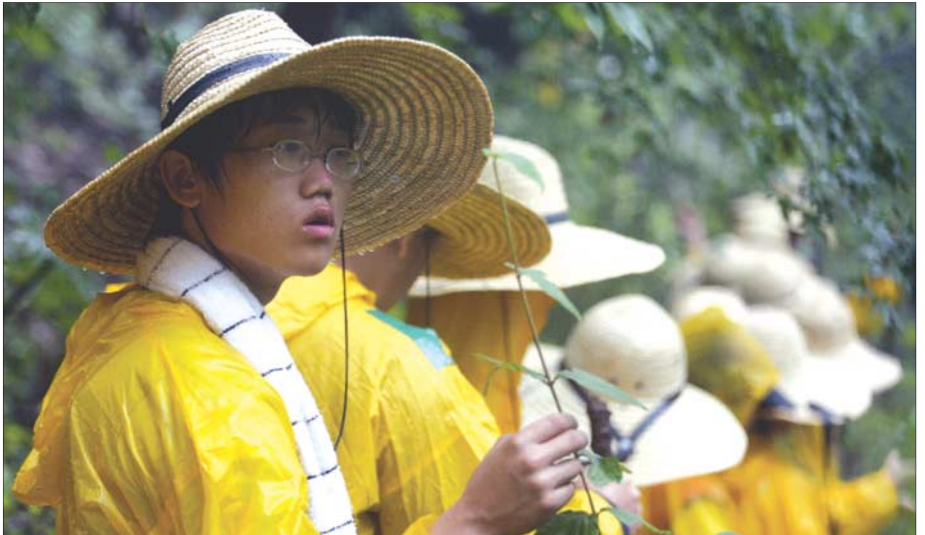
140여명의 청년들이 대구에서 부산까지 매일 20km 걸으며 8일간 진행한 '파란 2004'. 하루 10시간씩의 도보로 발에 물집이 생기고, 코피를 쏟아도, 그들은 멈추지 않았다. 천성산과 지물 스님을 살리기 위해, 자연과 인간이 공존하는 세상을 만들기 위해.