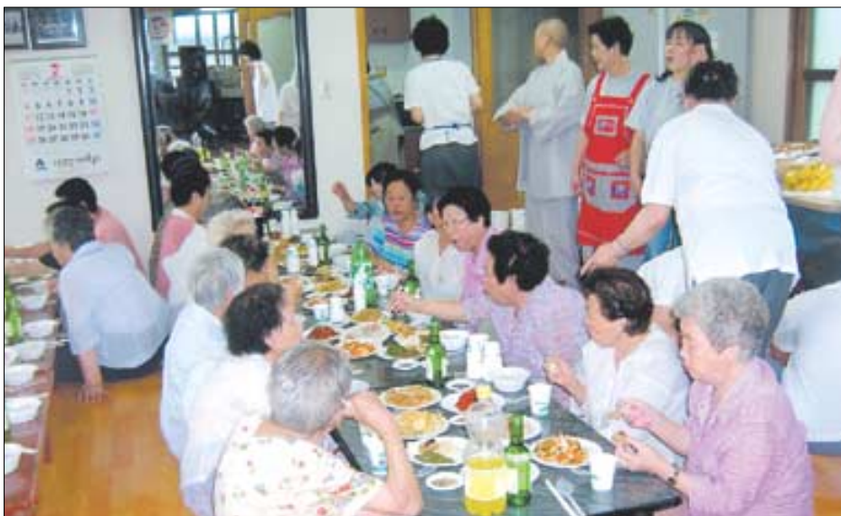
부처를 닮은 사람들은 7월1일 수원 북수동 노인회관에서 위안잔치를 개최했다.