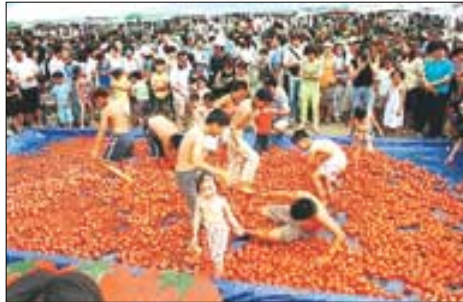
▲제1회 화악산 찰 토마토 축제.