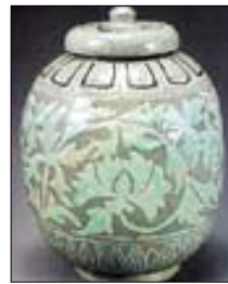
'분청사기'박지자연어문면' (위)과 '분청사기'상감모란당초문호'