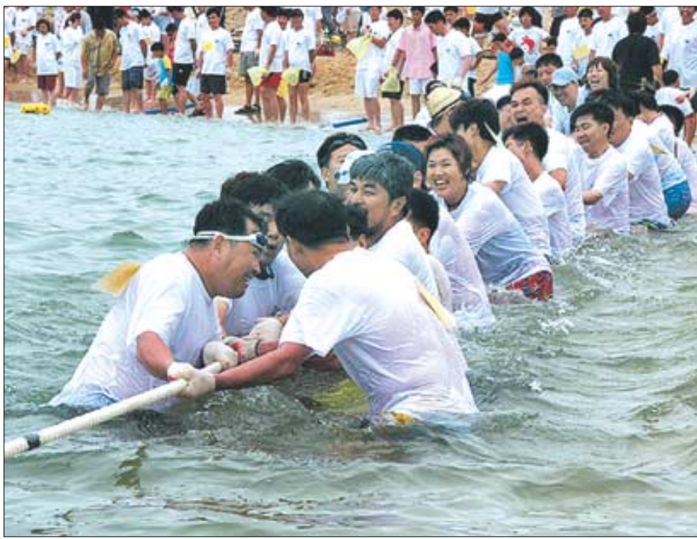
태안군 오징어 축제에 참가한 시민들이 오징어잡이에 앞서 비눗속 줄다리를 하고 있다.