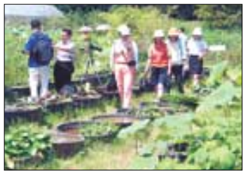
▲김제 청운사의 하소백련 축제.