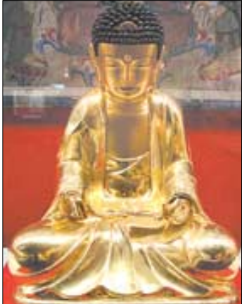
삼국시대 소조상인 익산 제석사지 소조상(위)과 불주사 목조아미타불 좌상.