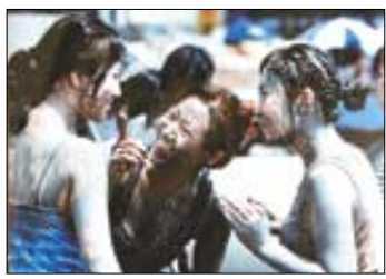
▲제6회 보령머드 축제.