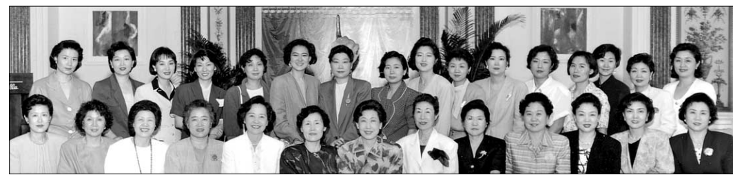
한자리에 모인 불이회 회원들. 창립 30주년을 맞아 젊은 회원 영입을 추진하고 있다.