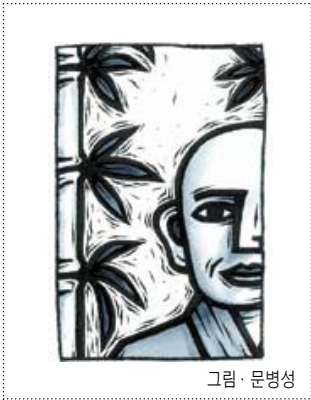
그림 · 문병성

공부가 환희심으로 가득해서 세상사는 초연하게 지내는 일이 도(道) 뒤는 일에는 최고라는 한 가지 생각으로 살아 왔는데, 갑자기 포교를 하라 하고 하니 난감했다. 하지만 은사스님의 명령이니 거역할 수도 없다. 부처님 말씀을 대중에게 널리 전하는 포교의 길은 처음 들어섰지만 성실과 인내로 꾸준히 했다. 한창 강남에는 능인선원, 강북에는 사천왕사 라고 해서 서울 도심포교의 거점 역할을 하고 있는 즈음이었다.