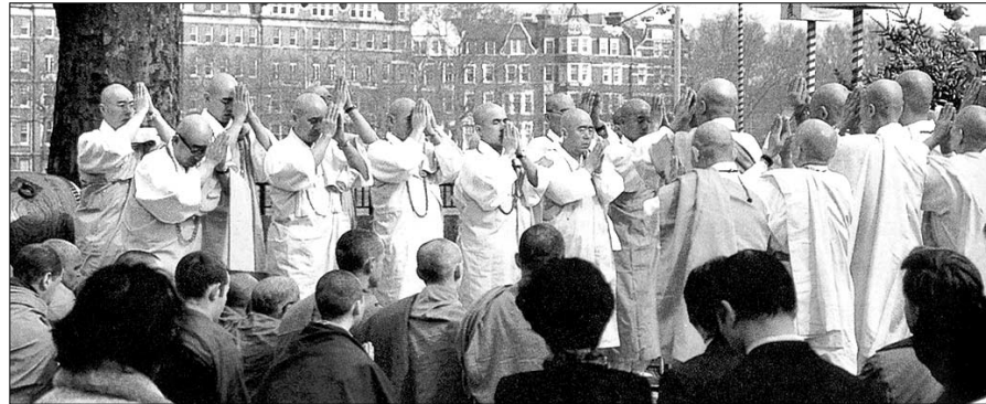
영국 런던 배터시 공원에 있는 '평화를 위한 사원'에서 열린 범불교 모음.

수는 "지은이는 종교를 복합적인 세계관으로 보고 접근하고 있다. 그렇게 보았을 때 종교는 비로소 더 넓은 문화적 지평 속에서 인류의 삶의 현장에서 생동하는 세계관이라는 사실이 드러난다"고 말한다.