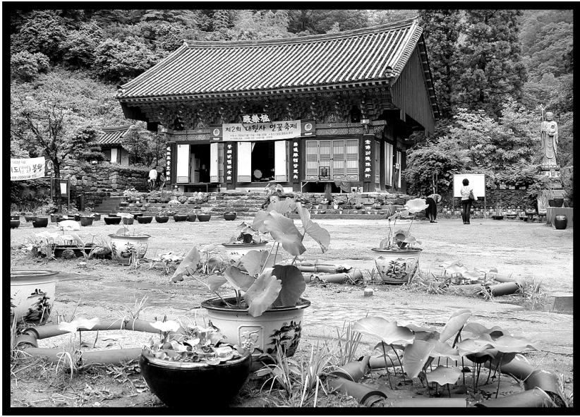
8월말까지 제2회 연꽃축제를 여는 보성 대원사. 연꽃 100여종과 수련 108종을 관람할 수 있다.