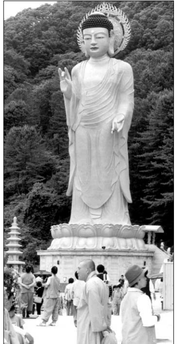
지상 36m 높이의 연화사 아미타대불. 불상 안으로 들어가면 7층까지 올라가며 부모은중경, 극락도, 지옥도 등을 참배할 수 있다.

“부처님 뱃속에 들어가 본 기분이에요?” “극락이 따로 없더군요. 어머니 품에 안긴듯 좋았어요.” 6월 16일 강원도 흥천 연화사(주지 화담)에는 높이 36m(아파트 12층 높이)의 아미타부처님의 친견을 기다리는 참배객으로 북적거렸다. 20여 명이 먼저 부처님 몸안 7층 높이까지 올라가며 부모은중경·극락도·지옥도 등을 관람하고 내려오자, 기다리고 있던 다른 불자들이 줄을 지어 올라갔다.