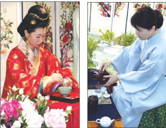
명원문화재단의 궁중다례시연(왼쪽)과 일본 일차의 전자시연 모습.