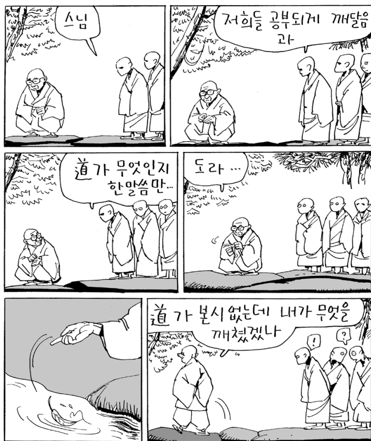
서암 스님(1914~2003): 경북 안동 生. 예천 서약사에서 화산 스님 은사로 득도. 금강산을 비롯 전국 선원에서 정진. 조계종 총무원장, 원로의장, 종정, 봉암사 조실 등 역임.

〈화엄경〉 '입법계품' 강의를 연재하였던 지난 일년 반 동안은 참으로 힘든 기간이었다. 첫걸음을 시작하는 신철 대학교의 여러 가지 업무로 삼심이 지쳐있는 가운데, '입법계품 강'의 원고 작성은 나에게 엄청난 고통스러운 일이었다.