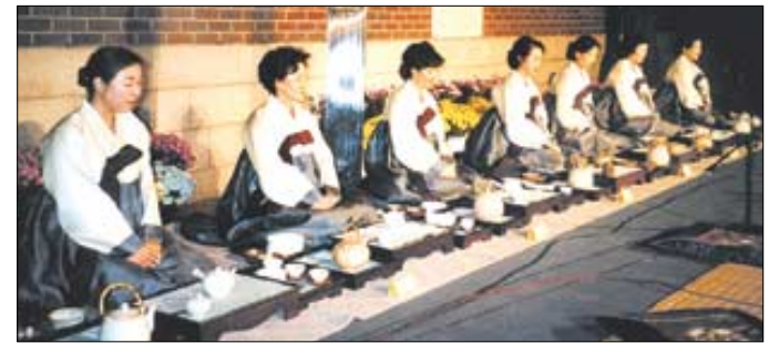
지난해 10월 서울 정동극장에서 열린 차 퍼포먼스 ‘찾잔에 담는 우리소리’에서 불광사 다도반 회원들이 행사시연을 하고 있다.

올해로 10년을 맞았다. 지난 1994년 11월, 날마다 부처님께 차 한잔이 올려지기를 바라는 마음으로 설립된 불광사 다도반은 그동안 차문화 보급과 차를 통한 수행문화 확산에 매진해 왔다.