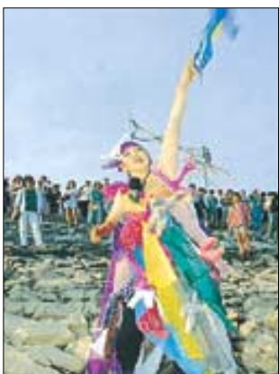
퍼포먼스 중인 흥신자 씨.