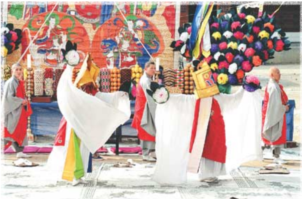
매해 단오날 봉행되는 신촌 봉원사의 전통 영상제.