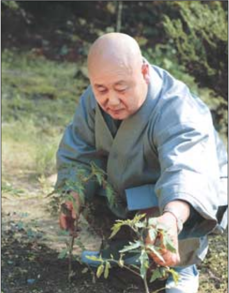
작은 토굴에서 손수 밭을 일궈며 수행하는 대해 스님.

나 염불을 해서 정(定)에 들면 굳이 계를 따로 지키고 말고 할 게 없어집니다. 그것을 정공계(定共戒)라고 합니다. 정에 들면 몸가짐과 말하는 것 등이 저절로 율의에 계합되어 버리는 것을 말합니다. 또한 도공계(道共戒)라고 하여 도를 통해서 부처님처럼 될 때는 계가 그냥 따라 오게 됩니다. 저절로 몸과 말의 허물을 여의게 되며 그때에는 거짓말을 해도 거짓말이 아니고 참말을 해도 참말이고 거짓말을 해도 참말이 됩니다. 이에 반해 중생은 아무리 참을 말해도 거짓말이 되는 것입니다. 많은 사람들이 계를 사다리 삼아 차근차근 건강성불을 향해 밟고 올라가 하는데 한꺼번에 정상으로 뛰어오르려고 욕심을 부립니다. 사람이면 누구나 있는 탐진치 삼독을 없애고 계를 통해 도의 길에 들어서야 합니다. 탐진치가 끊어져야 비로소 소견머리가 나오는 것이니 일어나는 마음의 일렁거림을 없애는 것이 급선무입니다. 그러기 위해서는 목전에 명명백백한 형체 없는 놈을 볼 수 있어야 합니다. 한달 동안 밥은 안 먹어도 십시간 숨은 단 5분만 안 쉬어도 죽게 되지요? 그만큼 분명한 것입니다. 마음이 고요하면 그 놀이 타하니 보이는 겁니다. 자성을 볼 수 있다는 얘기입니다. 그때부터 소견이 열리기 시작하고 그래서야 공부 힘을 얻었다 할 수 있습니다. 그 이후의 공부, 즉 보임을 해 나가야 삼천대천세계를 손바닥에