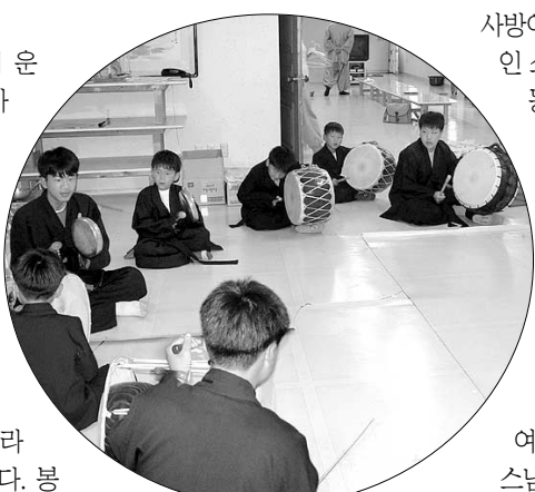
풍물습사를 뽐내고 있는 청계사 아이들.

경북 청도군에서 온 문자 쪽으로 가다가 나타나는 금곡리 마을 마을의 고향 청계사에는 이렇게 스님과 사내아이 10명이 살고 있다. 산과 계곡에 둘러싸인 아늑한 법당에는 ‘부처님 마음’이라는 현판이 눈에 띈다. 봉고가 경내로 들어가자 멍멍이 굶주림이 반갑다