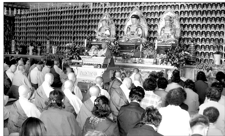
정법사는 지난 4월 천불을 모신 대웅전 중창불사를 마치고 낙성법회를 가졌다.

서울 성북구 성북 2동에 위치한 정법사. 정법사에 발을 들여놓기 전까지는 서울 한복판에 이런 사찰이 있을까 싶을 정도로 도심에서는 찾아보기 힘든 단아하고 정갈한 모습이다. 주변 경관도 아름다워 ‘휴식처’ 같은 포근함이 느껴진다.