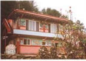
○7일 정진기도 도량

옛절은 일제시대때 소실되었으며 소속 구원이 복원 불사 중 명속에 묻혀있던 두 부처님을 발견하고 정성껏 관측하여 세롭게 금으로 개금하여 원흥사에 모셨고, 이 부처님께서 기이한 피흘리는 기적을 보여주고 있습니다.