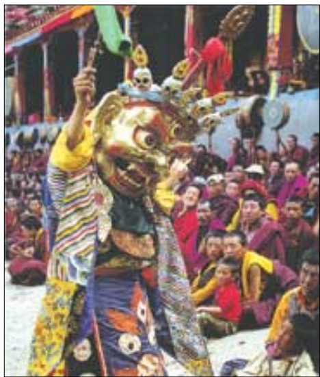
동물의 털을 쓰고 동물신을 체현하는 수도승.

티베트 마법의 서 알렉산드라 다비드 벨 지음 김은주 옮김 르네상스 | 1만2천원