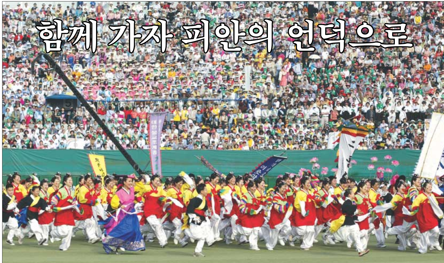
힘찬 발걸음으로 연인원 30만명이 동참한 올 연등축제는 다양한 볼거리와 참여마당으로 어느해보다 흥겨운 한마당이였다. 사진은 동대문 야구장에서 열린 어울림마당에 참가한 청소년들이 공연을 위해 힘차게 뛰어나가는 모습.