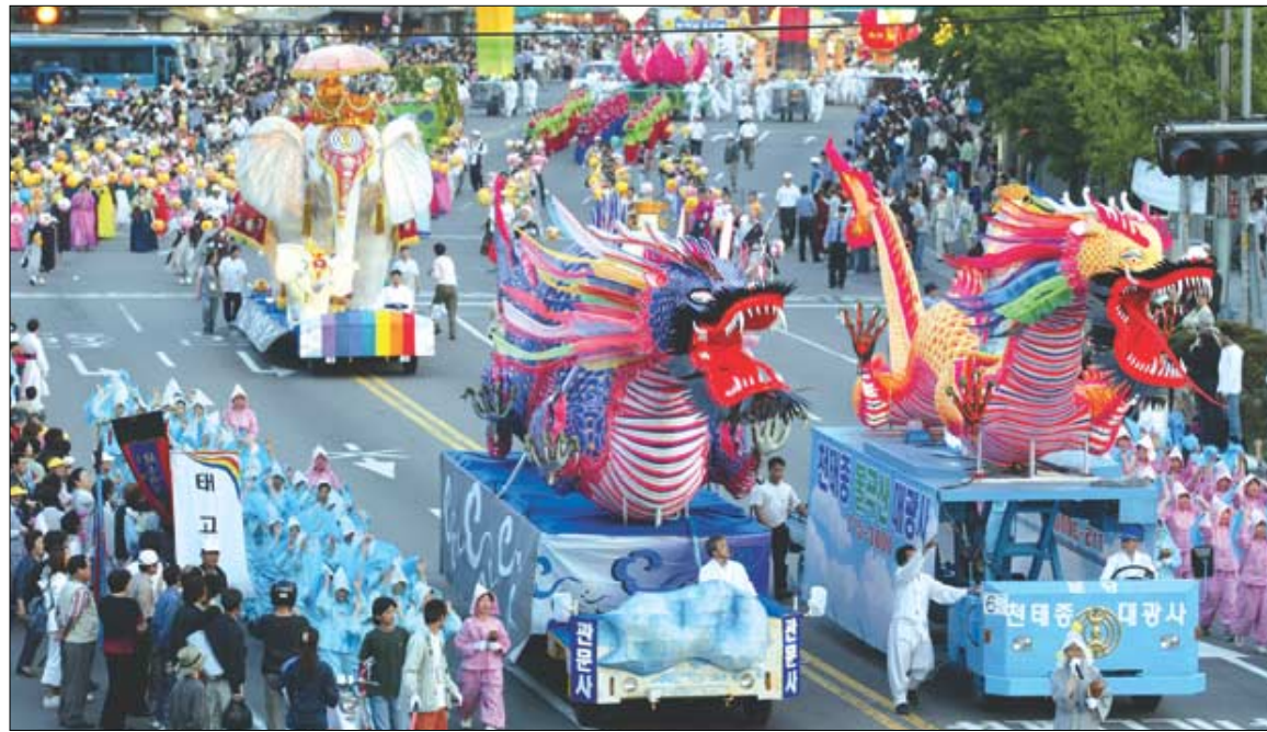
위풍당당 '용등' 천태종의 '용등'은 화려함과 위풍당당함으로 많은 이들의 눈길을 끌었다.