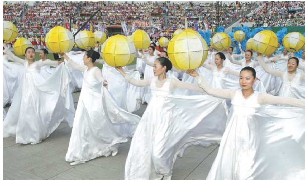
'역시 한마음' 올해 등 경연대회 단체 행진등 부문에서 최우수상을 수상한 한마음선원 신도들이 밝빛 등을 들고 율동을 선보이고 있다.