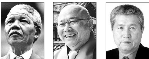
넬슨 만델라, 법타, 임권택

남아프리카공화국의 넬슨 만델라 전 대통령이 제 8회 만해대상 수상자로 결정됐다. 만해사상실천선양회(총재 법산·조계종 총무원장)는 5월 12일 서울 태평로 프레스센터 13층 회의실에서 기자회견을 열고 “만델라 전 대통령은 인권지도자로서 남아공의 인종차별 철폐를 통해 인류와 세계 평화에 큰 기여를 했다”고 선정 이유를 밝혔다.