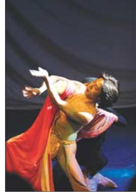
청도 국제소싸움축제에서 체급별 소싸움 모습(위)과 춘천 국제마임축제에 선보일 프랑스·브라질 '도아트' 팀의 공연모습과 국내팀 '프로젝트판'의 공연 모습(아래).

대회와 고래당기 대회, 고래일음조각대회 등 모두가 함께 참여할 수 있는 행사들로 진행된다. (052)226-5417 청도 국제소싸움축제 농경문화의 정취와 함께 민중들의 시름을 달래주고 흥을 돋우어 주는, 소싸움이 국제적인 축제로 다시 태어난다. 청도군이 5월 22일부터 25일까지 이서면 서원천변에서 진행되는 '2004 청도 국제소싸움축제'가 바로 그것. 축제는 국제소싸움대전과 체급별 소싸움, 전국사신활영대회, 주한미군 로데오 경기, 세계민속 공예품 전시, 농경생활 전시회 등으로 다양하게 펼쳐진다. (054)370-6373 춘천 국제마임축제 몸짓으로 표현하는 세계. 프랑스 미모스 마임축제, 영국 런던 마임축제와 어깨를 나란히 하는 아시아의 대표적인 마임축제가 열린다. 춘천시가 5월 26일부터 30일까지 마임의 집, 불내극장, 춘천인형극장 등에서 펼쳐지는 '춘천 국제마임축제'가 그것. 축제는 '프로젝트판' 팀과 프랑스·브라질 '도아트' 팀 등의 초청공연과 자유참가공연, 아마추어공