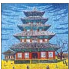
실종보 씨의 '범주사 팔상전'.

따뜻하고 아름답게 일상을 그려내는 화가 실종보 씨의 '백두대간을 따라와서 - 그 속의 일상'전이 5월 7일부터 18일까지 부산시내 열린화랑에서 열린다. 이번 전시회에서는 실종보 화백이 4년 동안 백두대간을 따라 내려오며 그림 속에 담아낸 오대산 월정사, 속리산 범주사, 가산해인사, 달마산 미황사를 비롯 설악산 울산바위, 동해 추암마을 등을 만나볼 수 있다. '관념적 풍경이 아닌 직접 우리 산하를 체험하고 재구성한 우리 산하의 풍경, 삶을 그리고자 했다'는 화가의 말에서 알 수 있듯 4년간 백두대간을 직접 답사하며 우리 산하의 아름다움을 화폭에 담았다. (051)731-5437