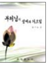
부처님의 생애와 가르침 한갑진 지음 한진출판사 | 1만원

“지금 우리 사회에는 배움, 즉 보시가 무엇보다 필요합니다. 불자들의 가장 큰 보시는 물론 바라밀을 성취하는 것이지만, 그 길로 이끌어 주는 법보시도 그에 못지 않은 소중한 배움이 아닐까요?”