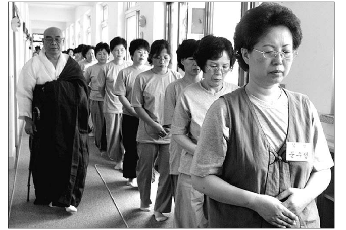
수련생들에게 보현선을 지도하는 해거스님.