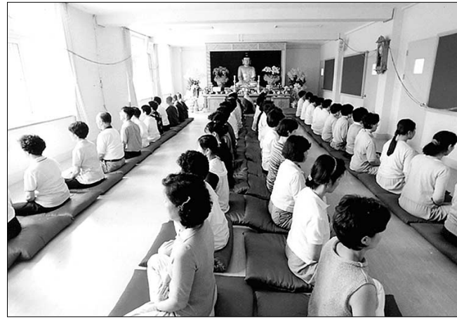
홍천 선문장에서 수련생들이 참선하는 모습.

-금강선원은 전통적인 조사선 수행을 원칙으로 하되, 입문자들을 위해서는 여래선(위빠사나, 지관법(止觀法) 등)의 장제도 도입하여