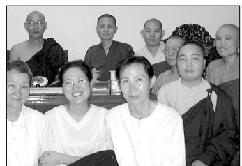
미얀마의 세우민센터의 한국 수행자들.