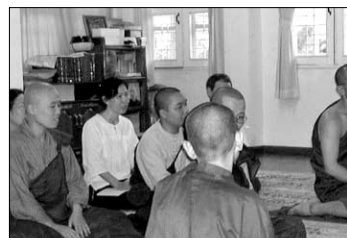
세우민센터에서 스승과 인터뷰를 하는 수행자들.

으로 몸 느낌 마음 법(身受心法)에 가지를 반복해서 관찰하는 수행으로 보면 된다. 현재 남방불교 국가들의 대표적 수행은 ‘위빠사나’이다. 특히 출세기에 걸쳐 널리 보급되어 있는 나라이미얀마로서, 미얀마 불교를 살펴 보면 남방 상좌부 불교를 볼 수 있다 해도 과언이 아니다. 지난해 미얀마 세우민 센터에서 수행할 기회가 있어 미얀마 불교를 접해볼 수 있었다. 되돌아보니 그것은 일생에 있어 큰 복이었다. 세계적으로 위빠사나 수행이 오늘처럼 대중화 된 것은 50여 년 전 미얀마의 마하시 사야도(1868~1954)가 근근불교 경전인 <대념처경>을 근거로 수행법을 체계화하면서부터다. 그 후 세우민, 모곡, 순론 등 마하시 사야도의 제자들이 미얀마 곳곳에 수행센터를 세우면서 위빠사나 수행이 일반화 됐다. 특히 이들 수행센터 가운데는 외국인들을 위한 통역과 수행센터의 현대화로 서방의 외국인 수행자들이 많이 모이고 있다. 한국인 수행자도 매년 100여명이