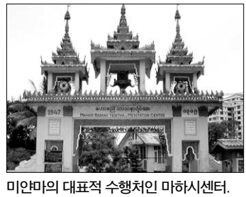
미얀마의 대표적 수행처인 마하시센터.

전통을 이어오고 있는 아시아 남방 국가들의 불교를 지칭한다. 역사적으로 보면 오늘날의 남방불교는 불멸 후 인도를 통일한 아쇼카왕(B.C. 273~232)이 아홉 번에 걸쳐 해외에 포교사를 보내면서 맥을 이어오게 됐다. 여덟 번째로 파견된 곳이 미얀마이고 아홉 번째가 스리랑카이다.