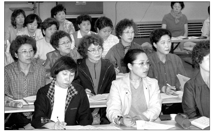
동국대 불교대학장 현각 스님의 특강을 경청하는 지장선원 신도들.

수도권에서 부처님 법을 공부하려면? 안양불교대학의 한 거사는 "망설일 것 없이 지장선원으로 가라"고 말한다. 종교나 종파를 초월해서 불법을 배울 수 있는 곳, 깨달음 추구와 이타행을 실천할 수 있는 곳이 바로 지장선원이라는 생각에서다.