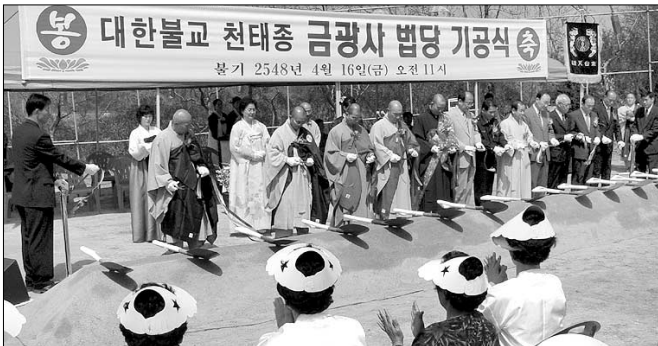
광주 금광사는 전통사찰 양식의 3층 규모로 건립된다.

금광사는 4월 16일 천태종 총무원장 윤덕 스님을 비롯 종단 임원 스님과 지역기관장, 신도 등 300여 명이 동참한 가운데 금호동 백석산 금광사 경내에서 '법당 기공식'을 봉행했다.