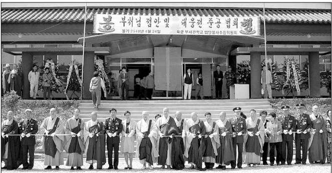
법회 참석자들이 육군 부사관학교 법당 개원을 축하하는 테이프 커팅을 하고있다.

국내 최대 하사관 양성기관인 육군 부사관학교에 최대 1200여명의 군 불자가 동시에 법회를 볼 수 있는 대법당이 건립됐다. 전북 여산에 자리한 육군 부사관학교 호국종교사(주지 정념 스님)는 4월24일 대웅전을 중창하고 법당 개원 및 불상 봉안법회를 병행했다. 이날 법회에는 조계종 포교원장 도영 스님을 비롯 조계종 원로의원