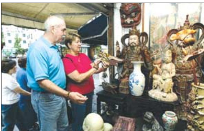
'고미술 명품 대전'에 출품된 불상과 백자접시(위), 외국인들이 인사동 골동품점을 둘러보며 즐거워하고 있다.(오른쪽)