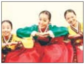
어린이 창극 '춘향이와 몽룡이의 사랑 이야기'의 한 장면

"이리 오나라 업고 놀자. 사랑 사랑 내 사랑이야 사랑이로구나 내 사랑~♪." 은 가족이 함께 즐길 수 있는 국악 공연이 5월 5일, 6일 이틀에 걸쳐 국립극장 달오름극장에서 펼쳐진다.