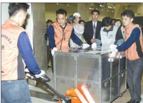
유물을 수장고로 옮기고 있는 운송팀의 표정이 진지하다.