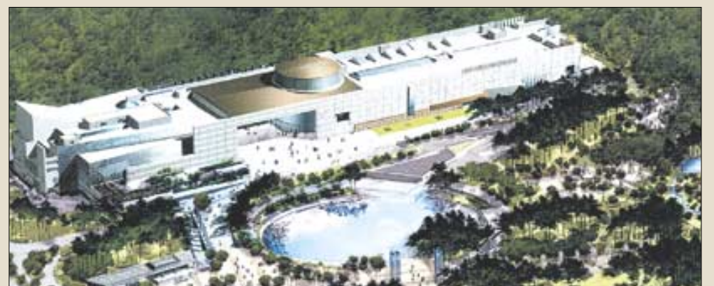
용산에 들어서는 새 국립중앙박물관 조감도. 지하 1층, 지상 3층 규모에 전시면적만 8천여평으로 박물관 서쪽에서 동쪽까지 404m나 되는 초대형 박물관이다. 상설전시관 43개와 기획전시실, 어린이 박물관, 야외전시장, 수장고 21개를 갖췄다.

광화문에서 용산까지 9.5km를 이용해 새 박물관 수장고로 들어오는 유물을 풀어놓기 전, 수장고에선 유