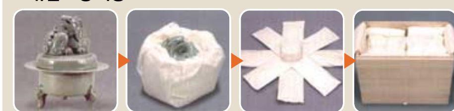
청자양각 기린형 향로 포장 과정. 향로의 몸체와 뚜껑을 각각 한지로 싸 후 솜포로 다시 감싼다. 포장은 오동나무에 넣어 마무리한다.