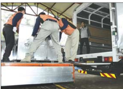
수장고에서 꺼낸 상자를 무진동 차량에 싣고 있다.