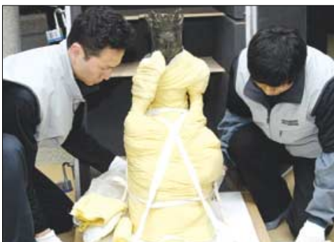
몸체 포장을 마친 상태.