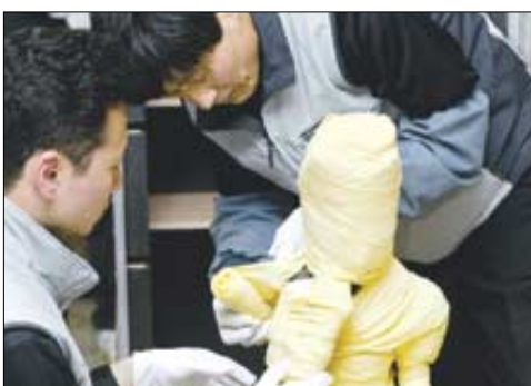
얼굴을 소장지로 단단히 감싸고 있다.