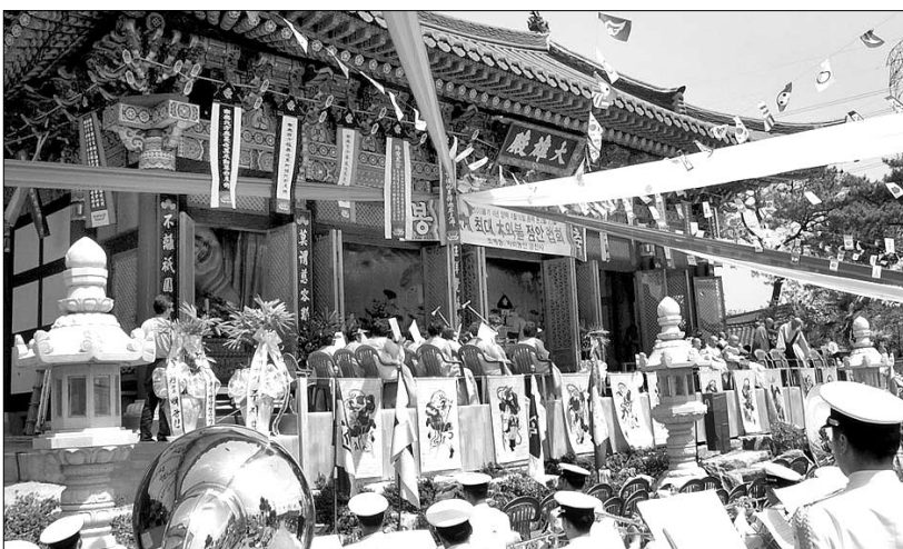
부산 금산사 칠여래 천불 점안법회가 3백여명의 사부대중이 참석한 가운데 봉행됐다.