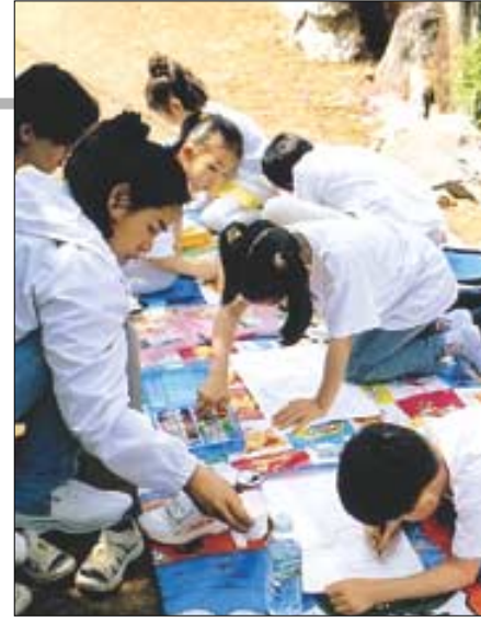
지난해 '전국 어린이 부처님그림 그리기대회'에 참가한 학생들이 부처님 얼굴을 그리고 있는 모습.