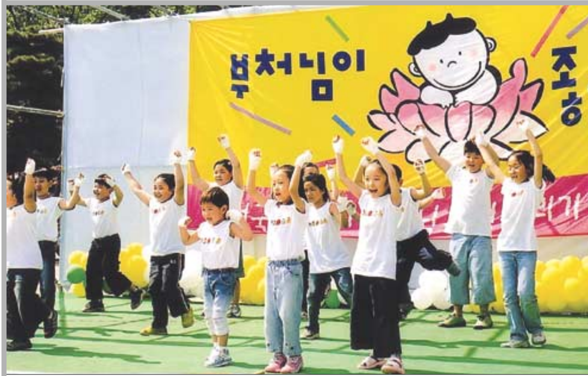
지난해 '제15회 연꽃노래잔치'에 참가한 어린이들이 합창을 하며 노래 솜씨를 뽐내고 있다.