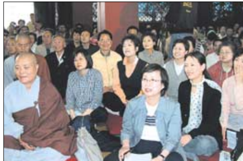
“여러분, 몸뚱이가 여러분 거러면 마음대로 돼야 하죠. 맘대로 된다가, 안되죠?” 예.