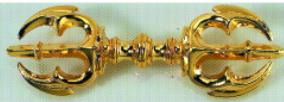
가족의 수호신 삼고 금강저

1분 앞도 모르는 험한 세상 남치, 살인, 간음, 강도, 유괴, 사교, 근심과 걱정 속에 사는 현실입니다. 삼고 금강저는 부처님의 범구 중 범구로서 덕자를 화를 미리 피하게 하고 악한 사람을 쫓으며 부처님의 지혜인 금강의 지혜를 얻어 승리하여 가족을 지키고 자신을 지켜주는 불경에 담겨 수호신입니다. 2548년 부처님 오신 날을 기념하고 금강저 벨트 출시를 기념하기 위하여 벨트 구입 고객님께 평생 지니고 다닐 수 있도록 순금 도금 삼고 금강저를 특별공급을 마치고 특별 증정합니다. 여성에는 핸드백 속에 학생은 가방속에 노년과 어린이는 주머니속에 항상 넣고 다닐 수 있도록 제작 되었습니다. *별도 구입시 20,000원 추가 하시면 됩니다.