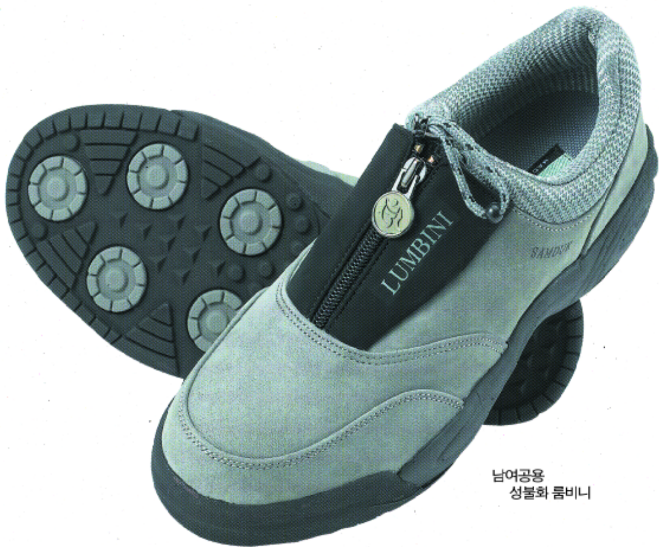
남여공용 성불화 롬비니