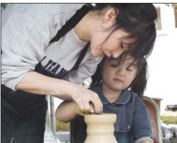
차사발 빚기 체험

올해부터 세계적인 문화, 관광축제로 거듭나는 제9회 하동야생차문화축제에서는 무려 60여 개에 달하는 행사가 펼쳐진다.