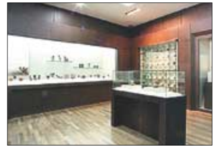
최근 재개관한 제주도 차박물관 내부 전경