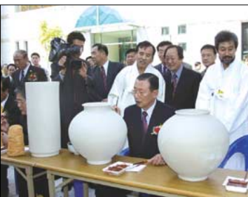
도자기 그림그리기 체험행사

문경시는 그동안 지역적으로 열려왔던 한국전통차사발축전과 문경산악제전, 전국관광하프마라톤대회, 전국한시