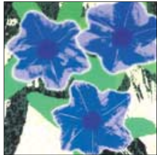
김광일 작 그래픽 아트 'DF040101'

변할 수 없는 자연의 섭리, 그 속에서 화려한 꽃송이로 본연의 아름다움을 뽐내는 꽃.