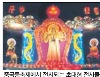
중국등축제에서 전시되는 초대형 전시물 '천수관음'

사천성 자공시정부가 직접 운영하는 자공등(燈)무관리위원회가 등 제작 분야에서 내로라하는 기술자 120명을 모아, 과천 서울대공원 특설전시장에 화물컨테이너 25개 분량의 크고 작은 등들로 ‘작은 중국’을 세웠다. 바로 주한중국문화원과 대진중국문화원 등이 주최하는 초대형등축제 ‘천하제일 중국등축제’ 현장. 축제는 당나라때부터 발전되어온 중국 대표적인 문화유산. 전통을 필두로 2m 높이의 용주예화, 100m 길이의 등방자등, 중국 법문사의 부처를 응축한 사면불상 등 30여개의 초대형 전시물들이 위용을 뽐낸다.행사는 5월 30일까지. (02)455-5331