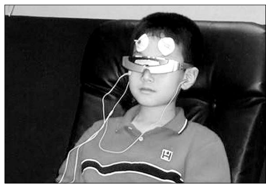
뇌파조절 학습기를 테스트하고 있는 학생.

그러나 인과대 신경과의 이일근 교수는 “특정 뇌파를 특정 작업과 관련짓는 것은 성급한 생각이며, 어떤 뇌파상태가 좋고 나쁘다는 식의 일률적인 평가 역시 오류”라고 밝혔다. 그에 따르면 뇌파조절기 등을 이용해 인위적으로 유도하는 알파파 상태가 고요하고 편안한 것만은 아니라는 것이다. 알 수면에 들었을 때나 혼수상태일 때도 알파뇌파가 검출된