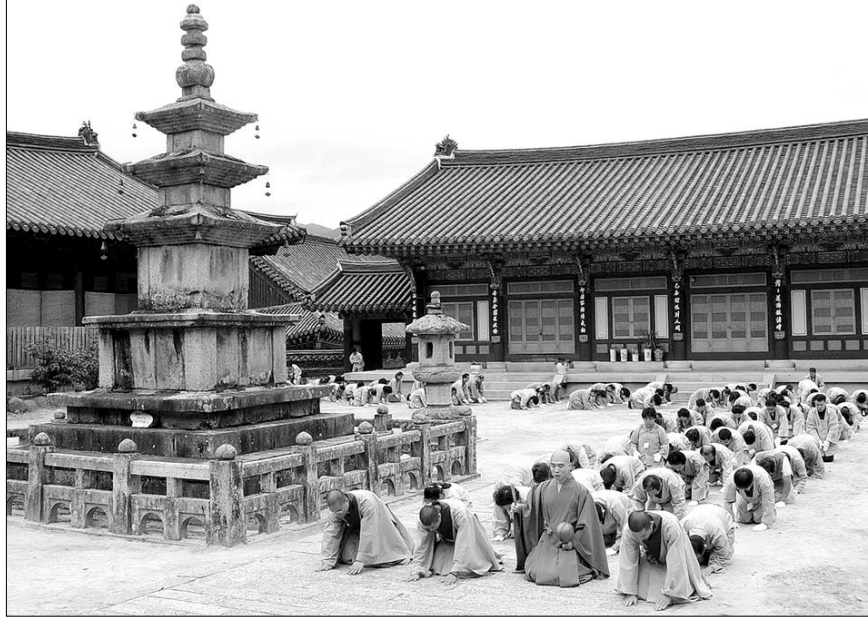
참다운 대승의 수행은 깨달음과 사회적 회향을 둘로 보지 않는다. 사진은 해인사 수련회에서의 정진 모습.