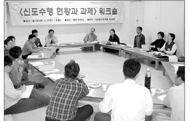
워크숍에서 참석자들이 신도수행 현황에 대해 토론하고 있다.

제가 불자들의 수행 현주소는 어디에 있으며 문제점은 없는가? 조계종 포교원은 4월 2일부터 3일까지 영주 부석사에서 ‘신도 수행 현황과 과제 워크숍’을 개최하고, 재가자 수행체계 확립을 위한 의견수렴의 시간을 가졌다.