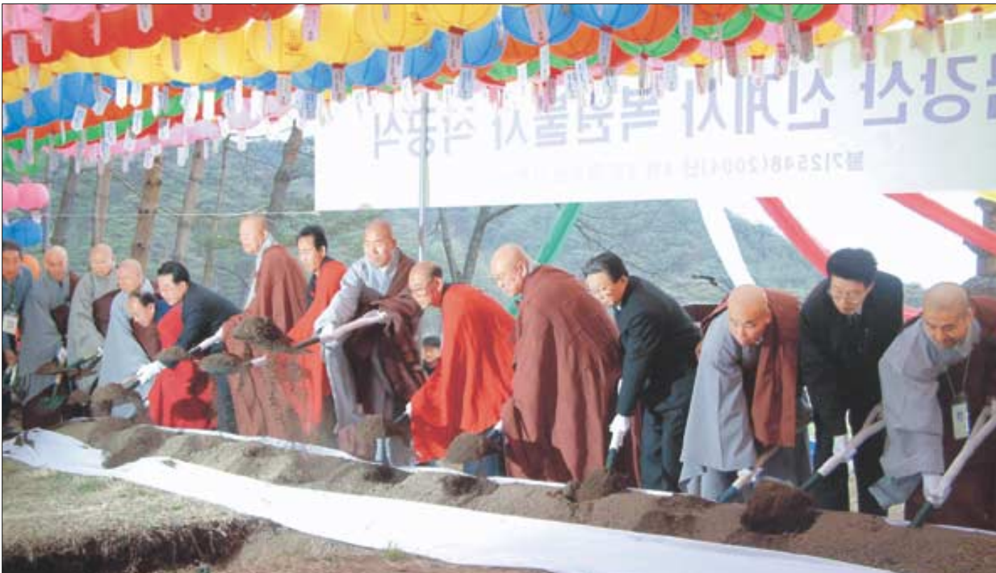
금강산서 남북 함께 통일불사 첫 삽 4월 6일 금강산 신계사 복원불사 착공식에서 남북 대표단이 민족 화합과 신계사의 원만한 복원불사를 기원하며 역사적인 첫 삽을 뜨고 있다. 권년기사 7면 금강산-오유진 기사