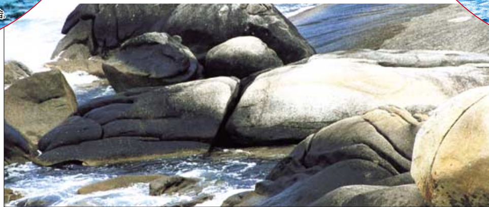
휴휴암 해중지에 관세음보살 손바닥바위, 손등바위.

휴휴암(休休庵)은 이름 그대로 쉬고 또 쉬는다는 뜻의 기도 정진도량이다. 즉, 팔만사천 번뇌를 모두 놓고 쉬라는 뜻이며, 몸과 마음을 편안하게 쉬라는 의미에서 지어진 이름이다. 법당이름은 묘적전(妙寂殿)인데 그렇게도 쉬어져 있는 사람들이 기도를 드리면 관세음보살님의 위신력으로 원하는 일들이 묘하게 이루어지라는 뜻