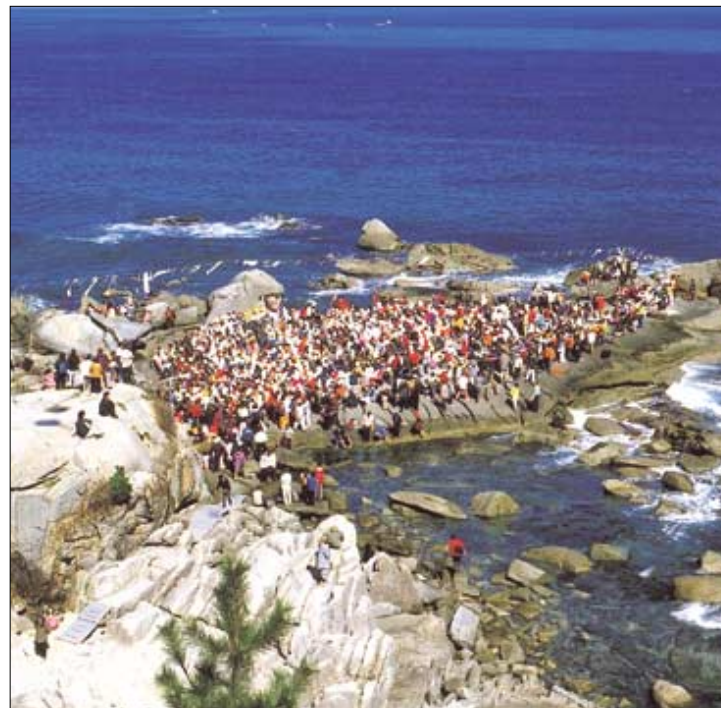
◇전국 각처의 불자들이 휴휴암 연화법당에서 새해 해맞이 기도 드리고 있다.