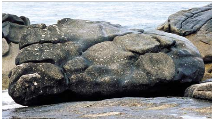
휴휴암 해중지에 관세음보살 발발바위 바위.

자태와 은은한 향기, 고아한 품격, 그리고 더러운 진흙 속에서도 청정한 꽃을 피우는 '처연상정(處染常淨)'이다. 즉 연꽃은 우리에게 탐진치 가혹한 사바세계에 살면서도 얼마든지 청정한 불성을 꽃피울 수 있다는 가르침을 주고 있다. 이러한 연꽃이 불상 주위에 피어났으니 그 신묘함을 어찌 말로 표현할 수 있겠는가. 누군가의 작품도 아닌 자연적으로 피어난 연꽃발에 누워 쉬고 계시는 모습은 마치 이곳이 연화세계가 아니냐 착각이 들 정도여서 수 많은 불자들의 또 다른 귀의처가 되고 있는 것이다. 9면으로 이어짐