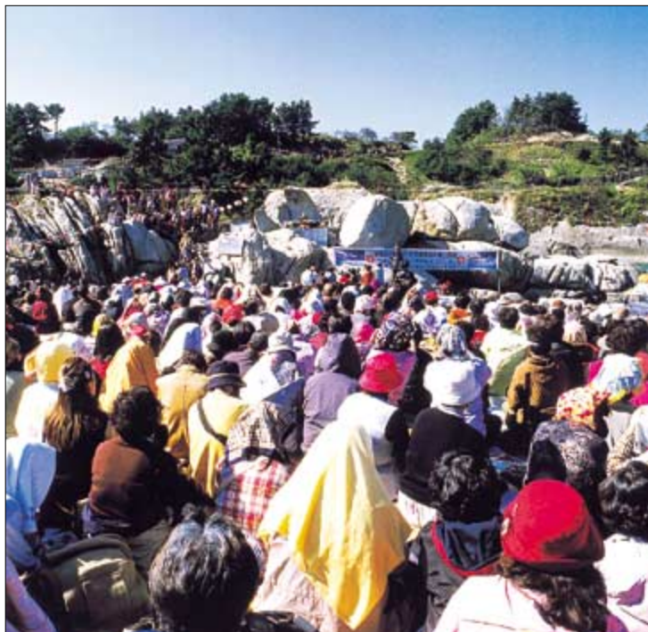
◇부처님오신날 많은 불자들이 연화법당에서 신묘장구대다라니를 독송하며 기도 드리고 있다.

동해안 기도성지로서 중생의 업보, 세속의 번뇌 망상을 쉬는 곳 휴휴암, 젊은 사람들을 쉬게 하는 곳이다. 탐욕으로부터, 삼냄으로부터, 어리석음으로부터 우리들을 쉬게 하는 것이다. 힘들고, 지치고, 외로운 사람들을 위한 휴휴암, 관세음보살의 큰 인력으로 쉼터를 찾게 될 것이다.