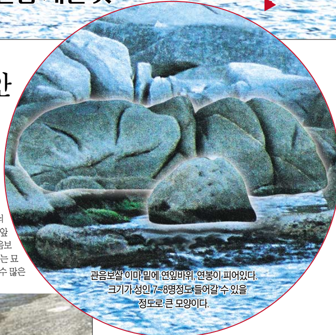
관세음보살 이마마위에 연일바위, 연봉이 피어있다. 크기가 성인 7~8명정도 들어갈 수 있을 정도로 큰 모양이다.

이다. 절을 지을 때부터 이처럼 예상하지 않은 서원이 세워져서인지 불사가 진행 되는 동안 묘한 일들이 휴휴암에서 일어나고 있다. 특히 5년 전 관세음보살님이 누워계신 채 휴휴암 앞바다에 나투신 것이다. 마치 9년 전 휴휴암이 창건되기 전부터 모든 번뇌를 내려놓고 쉬고 계신 것처럼 망망대해 앞에 머물러 계신 것이다. 근래 해중관세음보살님 주위로 말로는 어떻게 설명할 수 없는 묘한 일들이 벌어지고 있어 관음기도처로 수 많은