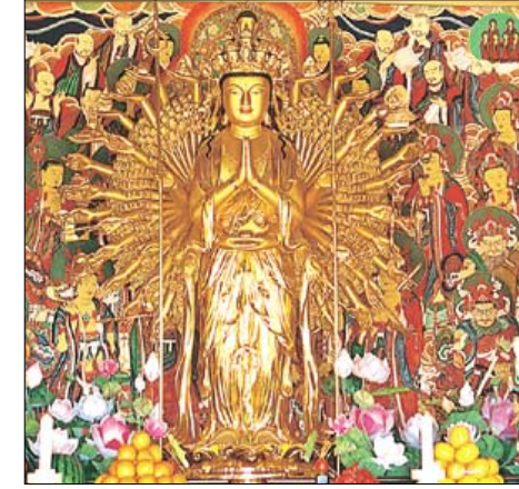
◇휴휴암 묘적전에는 천수천안 관세음보살님이 모셔져 있다.