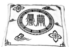
자동차사고 예방부 삼베방석

저희 부적패션샵에서 판매되는 제품은 부산PSB방송 [2003.11.11]아이디어 상품으로 방영되었으며