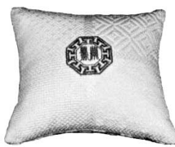
자동차사고 예방부 부적

본 제품은 강한 "氣"가 방출되는 신비스러운 "경명주사"로 염색한 [방명특허출원중] 특수실로 삼베에 자수하여 시원하고 건강에도 좋으며 "경명주사부적방석"은 나쁜 "氣"가 침범하지 못하게하여 운전자의 심신을 안정케하여 사고를 예방하고 자신감을 심어줍니다.