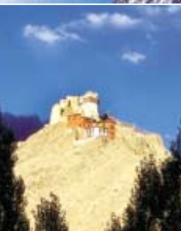
하얀 만년설의 위용을 엿보던 히말라야의 에베레스트산. 오른쪽 사진은 라다크의 체모포파.

카투만두 곳곳에는 오래된 왕궁과 사원들로 가득차 있어 중세 도시에 온 것 같은 착각을 불러 일으킨다.