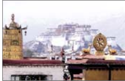
왕궁을 배경으로 서 있는 네팔인(사진 위), 조카사원 옥상에서 본 달라이 라마의 거룩궁전인 포탈궁.

을 이어왔다. 그 힘은 바로 공동체적인 삶에 있다. 그래서 라다크는 가난하지만 거지와 도둑이 없고, 시기, 질투, 성냄, 이기주의 등을 찾아볼 수 없다. '작은 티베트' '서쪽의 티베트'라는 별칭처럼 티베트 문화가 고스란히 남아 있으며, 부처를 향한 불심이 마음을 가득 메운다.