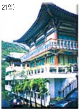
하와이 한인문화원 전경

* 참가학생 부모님의 경우 하와이 사찰에서 공동생활을 전제로 참가가 가능합니다. 참가비는 관광비용 포함해 1주 180만원, 2주 200만원, 3주 220만원입니다.