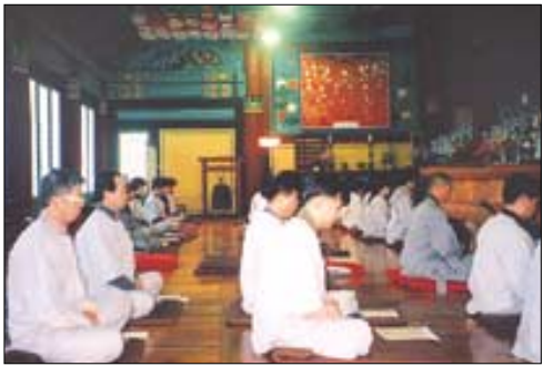
29년째 이어지고 있는 원명선원의 ‘삼매체행 선수련회’.

“본래 깨달아 있다’는 사실에 대해 믿기를 두려워하는 당신의 제자나 후대의 인류를 위해 부처님은 맑은 비유와 예를 들어가며 의심에서 벗어나게 하고 무지를 씻어주고자 설법하셨습니다. ‘본래 깨달아 있다’는 자신의 존재를 모른다면, 내면