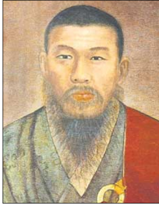
경허(鏡虛, 1849~1912) 스님

한번에 놀아 태평양 바다 속으로 던져 버리고, 다시는 들어 말하지 마라. 팔만사천 미세한 생각 머리를 잡아 단념에 끊어 버리고, 본래 참구하던 회두를 들어 일으키되, 맨 뒤 한 귀절에만 힘을 써서 들어 일으키어 들며 오고 들며 가다가 회두만 앞에 나타나서 들지 않아도 스스로 들어지며, 고요한 가운데나 시끄러운 가운데나 들지 않아도 들어지거든 바로 이때에 의심의 문장, 말로 말하는 삼매 등을 가져다