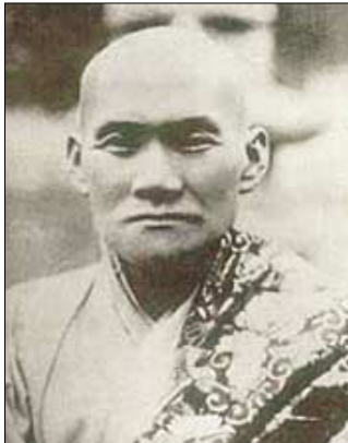
한암(漢巖, 1876~1951) 스님

만일 이와 같이 스스로 판단하지 못하면, 비록 만겁동안 수행을 한다 할지라도 마침내 얻는다. 오직 바라건대 일체 중생이 다 함께 몸과 마음을 바르게 하여 무상대도(無上大道)를 깨달아서 다시는 실패 그들에게